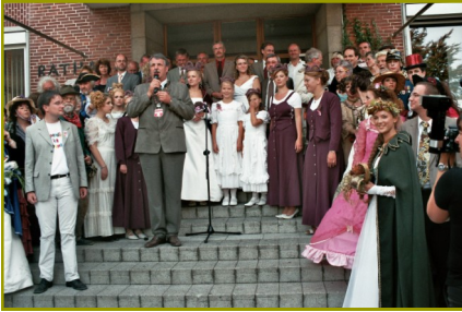
Alle Königinnen mit Gefolge auf der Rathausstuppe