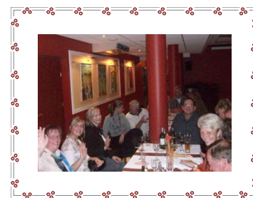
GEMÜTLICHER ABEND MIT DEN BARLINEKER FREUNDEN

Der Vorstand hat besprochen, dass eine solche Fahrt im Jahre 2010 wieder organisiert werden soll, vorzugsweise in der zweiten Maihälfte. Die Fahrt soll diesmal von Freitag bis Dienstag organisiert werden, damit es mehr freie Zeit für die Teilnehmer gibt, die vielfältigen Angebote in unserer Partnerstadt auf eigene Faust zu nutzen. Anders als bei der Fahrt 2008 soll es einen Preisnachlass für Mitglieder sowie einen Nachlass bei Nutzung eines Doppelzimmers geben. Der Fahrpreis wird voraussichtlich bei 240,- bis 260,- € (Halbpension, zahlreiche Programmpunkte) liegen. Ideen für die Reisegestaltung nimmt der Vorstand gern entgegen.